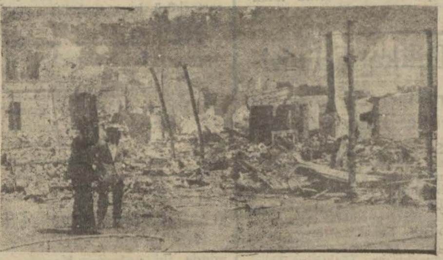
Zelzele mintakasındaki şehirlerden Gevgilin kısmen harap olduğu zamanki manzarası

Niş. (Husul) — Şimdiye kadar duyulan zelzelelerin adedi (150) yi bulmuştur. Yeni hasar olmamakla beraber şimdiye kadar östü berisi çatlıyan evler kâmilin yıkılmıştır. Yunan - Sırp hududundaki Gevgil şehri otulabilecek halden çıkmıştır. Pireveze ve (Mileşevo) istasyonları hâk ile yeksan olmuştur. Bu zelzelelerin vukuu sırasında şimdiye kadar tesadüf edilmiş bazı hadiseler müzahede olunmuştur. Meselâ (Prava) kasabası yakınında yer yarılarak bir-